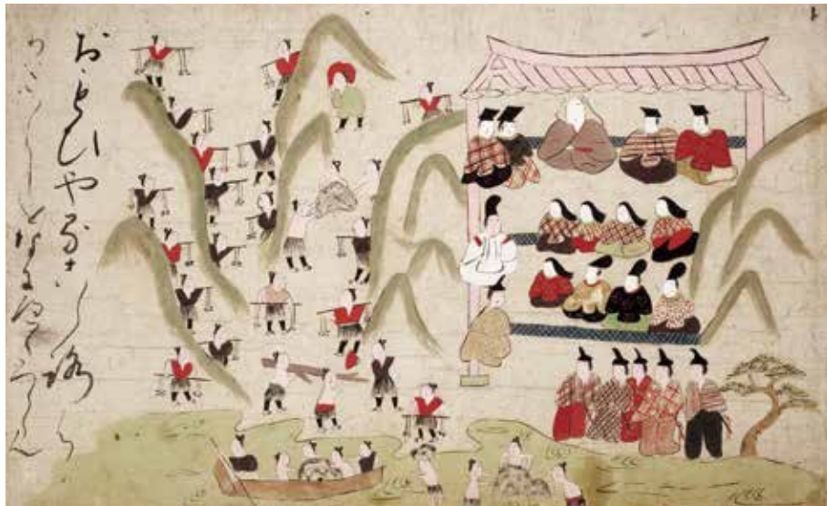
つきしま絵巻 室町時代(16世紀) 日本民藝館