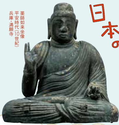
薬師如来坐像 平安時代(10世紀) 兵庫・酒殿寺