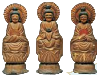
左:薬師三尊坐像 木喰明満作 江戸時代・文化4年(1807) 京都・蔭涼寺 右:大津絵「鬼の三味線弾き」 江戸時代(19世紀) 大津市歴史博物館