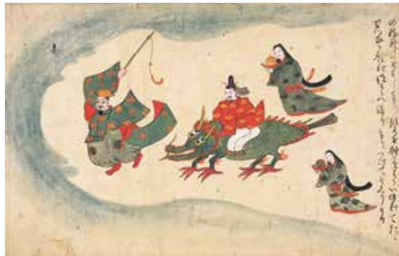
かみ代物語絵巻 室町時代(16世紀) 西尾市岩瀬文庫