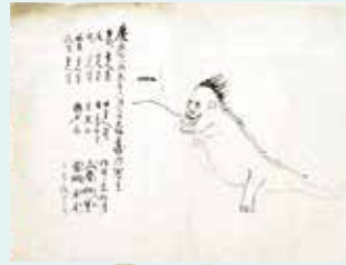
左:竹虎図 尾形光琳筆 江戸時代(18世紀) 京都国立博物館 右:大坂城堀の奇獣 江戸時代(19世紀) 湯本豪一記念日本妖怪博物館(三次もののけミュージアム)