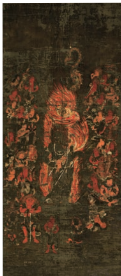
【重要文化財】不動明王二童子四十八使者像 南北朝時代 寶光寺(瀬戸内市) ※12/22~1/24まで展示