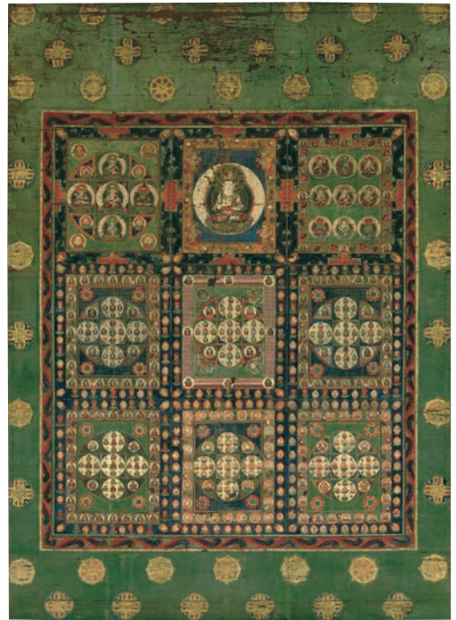
【重要文化財】同界曼荼羅のうち金剛界 鎌倉時代 寶光寺(瀬戸内市) ※11/21~12/20まで展示

このたび、岡山県立博物館の改修工事にあわせ、同館の所蔵品及び寄託品の一部をお預かりすることとなりました。本展では、多彩な宗教美術の中から「密教」と「神仏習合」という2つのテーマを柱とし、岡山県内に遺された名宝の数々をご紹介します。