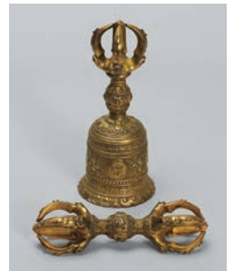
【岡山県指定文化財】金銅 五結杵・五結鈴 鎌倉時代 金山寺(岡山市)