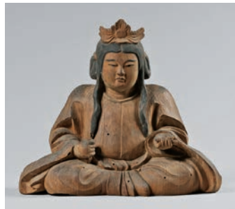
【岡山県指定文化財】木造 童形神(文殊大明神)坐像 南北朝・応安3年(1370) 摩賀多神社(久米郡)