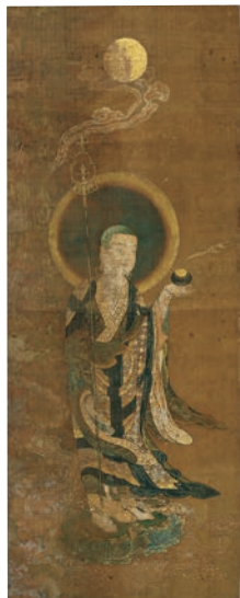
【重要文化財】地藏菩薩來迎図(僧形八幡神影向図) 南北朝時代 持澤寺(小田郡) ※11/21~12/20まで展示