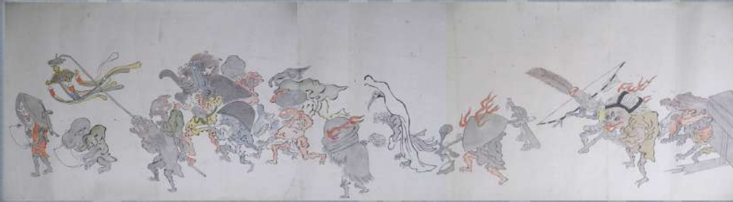
「百鬼夜行絵巻」 高台寺