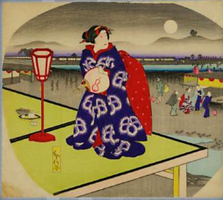
「四條河原夕涼み」 立命館アート・リサーチセンター