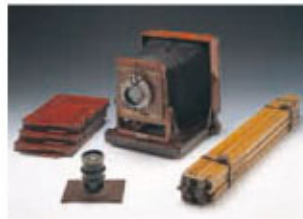
組立箱式カメラ一式 20世紀 吉川家 探検隊員・吉川小一郎が使用したカメラ。