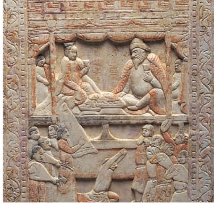
ソグド人墓 石椁扉門闕 中国 6世紀後半 MIHO MUSEUM ソグド人と漢人の夫妻。当時の多民族社会を象徴している。

本展覧会では、この大谷探検隊が日本にもたらした貴重な資料を中心に、仏教をその源流まで遡り、シルクロードにおけるさまざまな民族・言語・文化との交流を多角的に紹介します。多くの文化が共存した社会を体感し、大谷探検隊の足跡をたどってシルクロードの旅を満喫してください。