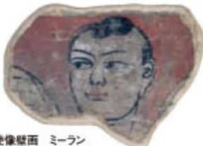
有翼天使像壁画 ミーラン 3世紀頃 東京国立博物館 ローマ文化の影響が感じられる天使。