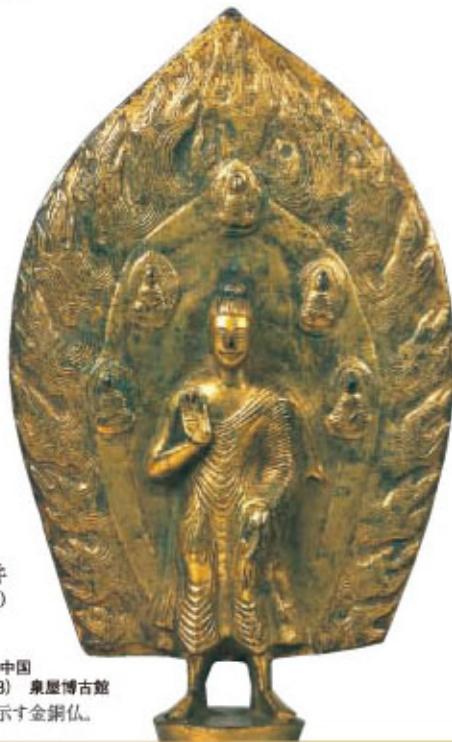
弥勒仏立像(重文) 中国 北魏・太和22年(498) 泉屋博古館 見事な肉体表現を示す金銅仏。