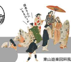
東山遊楽図屏風(部分)