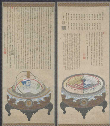
縮象儀 須弥山儀 龍谷大学大宮図書館