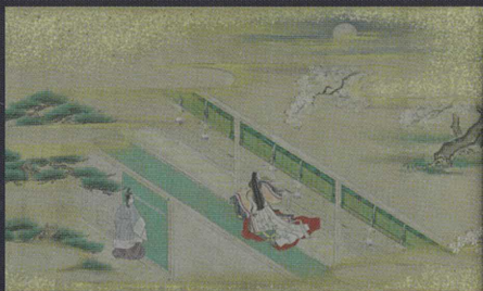
源氏画 龍谷大学大宮図書館