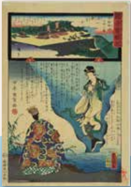
観音靈驗記 西国巡礼三拾二番近江観音寺 人魚 龍谷大学大宮図書館