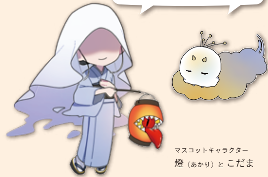
マスコットキャラクター 燈（あかり）とこだま