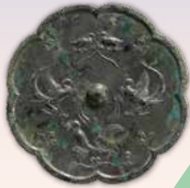
双鳳銜綬瑞鳥紋八花鏡 古代鏡展示館（兵庫県立考古博物館加西分館）