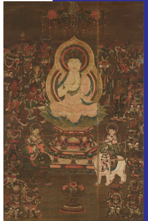
釈迦十六尊神像 鎌倉時代 香雪美術館(展示：9月21日～10月20日)