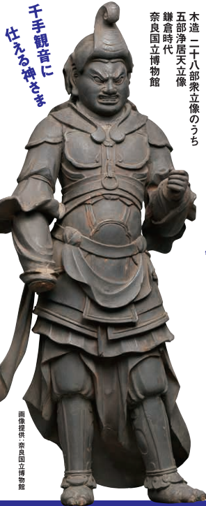
千手観音に仕える神々