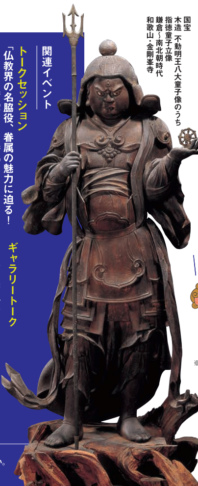
国宝 木造 不動明王八大童子像のうち指徳童子立像 鎌倉・南北朝時代 和歌山 金剛堂寺