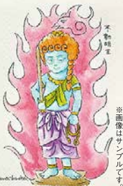
※画像はサンプルです。

日時：10月26日(土) 11時～17時 会場：龍谷ミュージアムエントランスホール 事前申込必要 参加費1,500円 観覧券不要