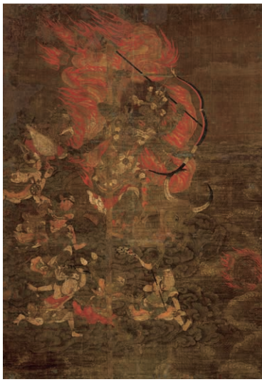
大威徳明王像 鎌倉時代 東京・墨雲寺 展示：9月21日～10月20日

仏菩薩など信仰の対象となる主尊に付き従う尊格のことです。仏教美術では主尊のまわりを囲むようにあらわされ、仏法を守護したり、主尊を信仰する者に利益を与えたりする役割を担っています。龍谷ミュージアムで昨年度開催した特集展示「眷属—ほとけにしたがう仲間たち—」が、この秋、特別展としてパワーアップし、各地から約80件の作品が集います。仏教美術における名脇役ともいえる眷属の個性豊かな姿をご覧ください。