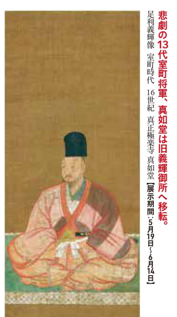
悲劇の13代室町将軍、真如堂は旧義禪師所へ移転。 足利義隆像 室町時代 16世紀 真正極楽寺 真如堂(展示期間5月19日~6月14日)