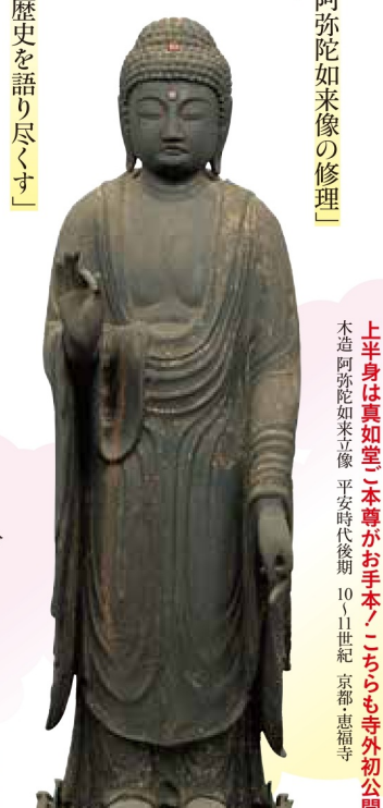
上半身は真如堂(本尊がお手本)こちらも寺外初公開 木造阿弥陀如来立像 平安時代後期 10~11世紀 京都 惠福寺

ギャラリートーク 展示室で作品の見どころを学芸員が解説します。 日時 4月26日(日)、5月16日(土)、 6月7日(日) 13時30分/14時15分 集會場所 龍谷ミュージアム101講義室 事前申し込み不要/聴講無料/当日の観覧券必要 関連イベントのお申込み方法 龍谷ミュージアムHP内のお申込みフォーム、 ミュージアム受付、お電話にてお申込みください。 各イベントの詳細は龍谷ミュージアムHPをご覧ください。 入館料 一般 1600円(1400円) 高大生 900円(700円) 小中生 500円(400円) ※(内は前売り・20名以上の団体料金) ※小学生未満、障がい者手帳等の交付を受けている方 およびその介護者1名は無料 ※前売り券は2026年3月10日(火)~4月17日(金)まで、 龍谷ミュージアムHP、オンラインチケット(Lコード:51996)、 センチチケットはか主要フレイグドなどで販売