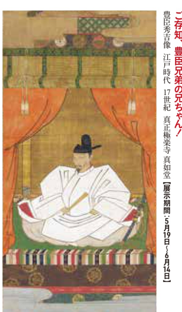
「存知、豊臣兄弟の兄ちゃん」 豊臣秀吉像 江戸時代 17世紀 真正極楽寺 真如堂(展示期間5月19日~6月14日)