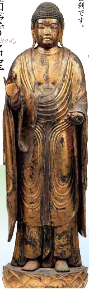
比叡山根本中堂の本尊がモデルの「天台薬師」。 木造薬師如来立像 平安時代後期 10~11世紀 滋賀・西教寺