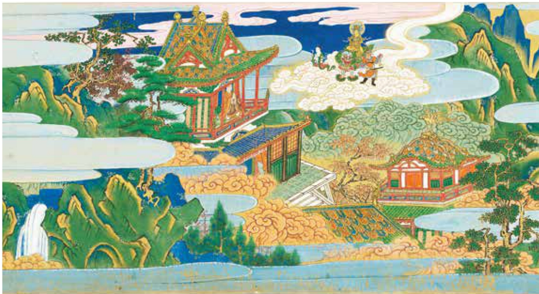
(上) 色鮮やかに語られる真如堂の物語。 重要文化財 真如堂縁起 巻上 絵:掃部助久国筆 詞:後柏原天皇(1464~1526)宸翰 室町・大永4年(1524) 真正極楽寺 真如堂 画像提供:京都国立博物館 【巻上 展示期間:4月18日~5月17日 ※巻替えあり】 (左下) 軸木は東大寺大仏殿の焼け残り、運慶一派の祈りの結晶。 国宝 法華経(運慶願経) 卷第二 琢賀筆 平安後期・寿永2年(1183) 真正極楽寺 真如堂 画像提供:京都国立博物館 【巻第二 展示期間:4月18日~5月17日】