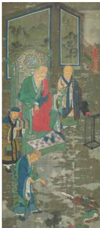
十八羅漢図 6幅のうち1幅 日本 南北朝時代(14世紀) 京都・廣誠院

シリーズ展「仏教の思想と文化—インドから日本へ—」では、インドで誕生した仏教がアジア全域に広がり、日本社会にも根付いていく約2500年の歩みを、大きく「アジアの仏教」と「日本の仏教」に分けて紹介します。