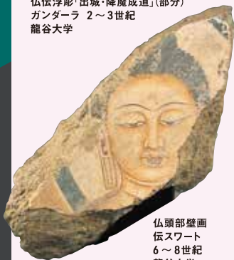
仏頭部 壁画 伝スワート 6~8世紀 龍谷大学