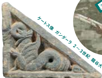
ケートス像 ガンダーラ 2~3世紀 龍谷大学