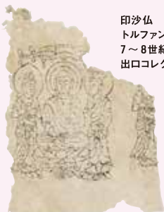
印沙仏 トルファン 7~8世紀 出口コレクション