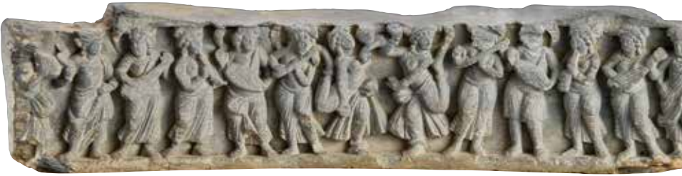
ナーガとナーギの奉養と踊り(部分) ガンダーラ 2~3世紀 龍谷大学