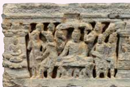
仏伝浮彫「出城・降魔成道」(部分) ガンダーラ 2~3世紀 龍谷大学