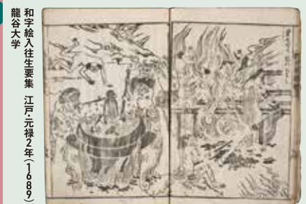
金銅十二面観音懸仏 室町時代 京都・法蔵寺 和字絵入往生要集 江戸元禄2年(1689)刊 龍谷大学

シリーズ展「仏教の思想と文化—インドから日本へ—」では、インドで誕生した仏教がアジア全域に広がり、日本社会にも根付いていく約2500年の歩みを、大きく「アジアの仏教」と「日本の仏教」に分けて紹介します。