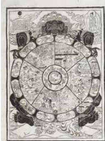
五趣生死輪図 ネパール 19~20世紀 龍谷大学