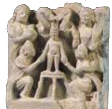
仏伝浮彫「灌水」 ガンダーラ 2~3世紀 龍谷大学

仏教美術には、ほとけや神々に寄り添う少し変わった姿のいきものたちが表されています。釈尊を暴風雨から護ったナーガ(大蛇)や、説法に耳を傾ける鬼神など、仏教説話にも多くのお話が伝えられています。今回は、インドから日本までのさまざまな地域で、それぞれの仏教美術を彩る名脇役、ひょっこり登場する“聖なる怪物”を取り上げます。この夏休みは、ぜひ会場で多様な怪物たちを探してみてください。