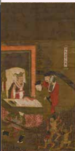
十王図のうち五官王 陸信忠筆 中国・元時代 京都・縁城寺

日本へ仏教が伝来し、日本社会に根付く 仏教伝来——仏教伝来にかかわる史実と伝承 国家と仏教——国家政策としての仏教導入と貴族社会への浸透 仏教文化の円熟と日本的展開——日本国内での仏教の歩みの上に新たに醸成され、幅広い階層に受け入れられていた仏教の諸相